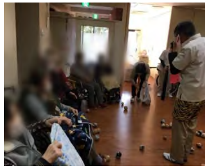
無事に鬼は退治できました♡♡

2021年2月3日ハートホーム東野で節分の豆まきをしました。皆さん手作りの豆を持って準備万端です。「鬼は外！福は内！」の掛け声で鬼に豆をぶつけます。