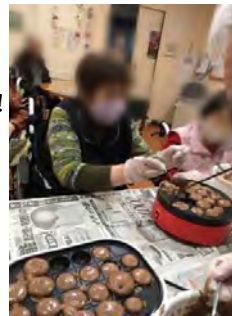
甘いもの好きにはたまりません！♡♡

バレンタインデーから少し時期は過ぎてしまいましたが、チョコ味のミニカステラを利用者の皆さんと一緒に作りました。