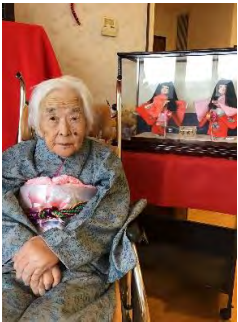
今年で101歳を迎えるA様(写真)着物がとてもお似合いです☆

少し時が過ぎますが、雛祭りに着物を着て写真撮影を行いました。自分で好みの色の着物を選んで頂き撮影を行いました。