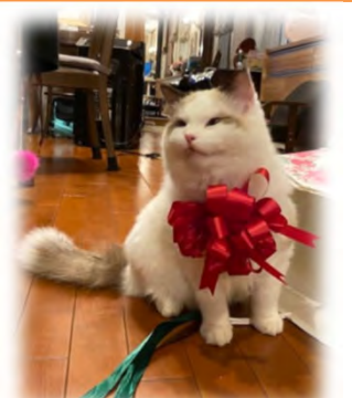
アトムです。2019年の10月に生まれました。ラグドールという種類です。これからもよろしくね!