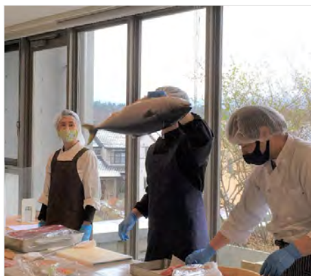
お寿司レクでのブリ解体

揚げたての天ぷら、捌きたてのブリはやはり格別でとても美味しかったです。おかわりもたくさん用意され、お腹いっぱい味わっていただけました。見ても食べても、両方楽しめる食事に皆様にも満足いただけたと思います。