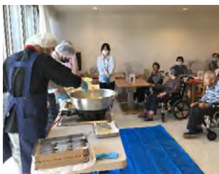
皆様の目の前で調理。専門店さながらの演出です。