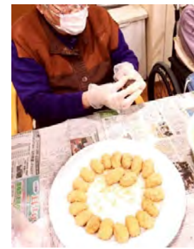
美味しそうなおはぎが並んでいます