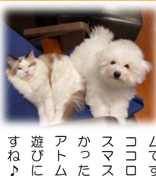
アトム「また遊びに行きますね♪」