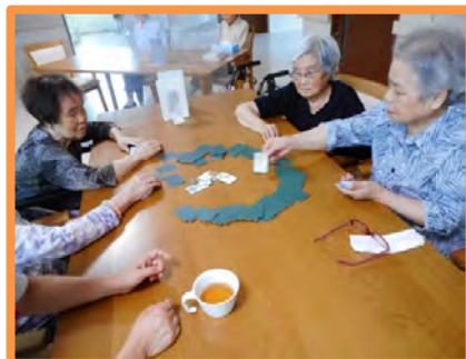
百人一首で遊びました