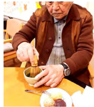
美味しかったです

11月には皆様と一緒におはぎを作りました。皆様楽しそうでした。慣れた手つきでご飯をつぶして一口サイズにしていけます。あんなにこやかな粉をまぶして完成!