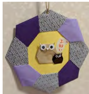
職員からのプレゼント「福老(ふくろう)」の壁飾り。お部屋に飾らせて頂きました。