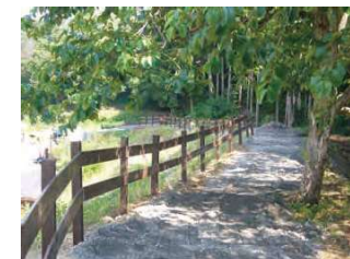
小道を抜けて農園やガーデンへ