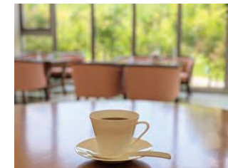
レストランやカフェで家族と一緒に