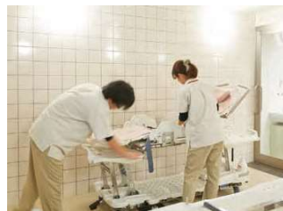
手厚い生活支援やサポート