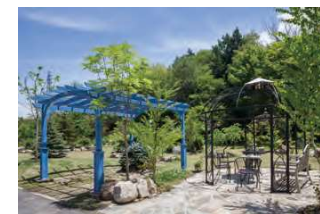
四季折々のウィングガーデン