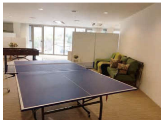
ゆったりとした共有スペース