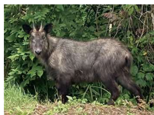
ニホンカモシカもやってきます